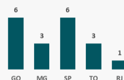
Concentração de Lastros/Região